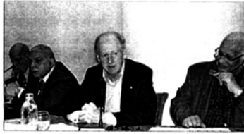
جانج من السويد