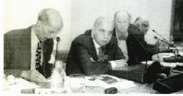
جانب من الحلقة النقاشية